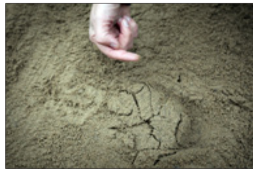
Ett fotavtryck i sand kan vara otydligt, men en tracker vet hur man fastställer kroppsrörelser och riktning med hjälp av detaljer i omgivningen.